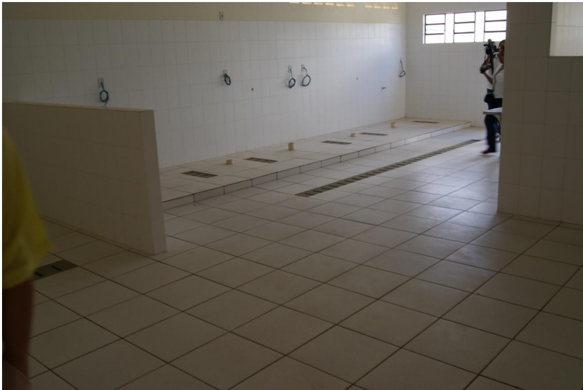
Futuras instalações da cozinha e lavanderia