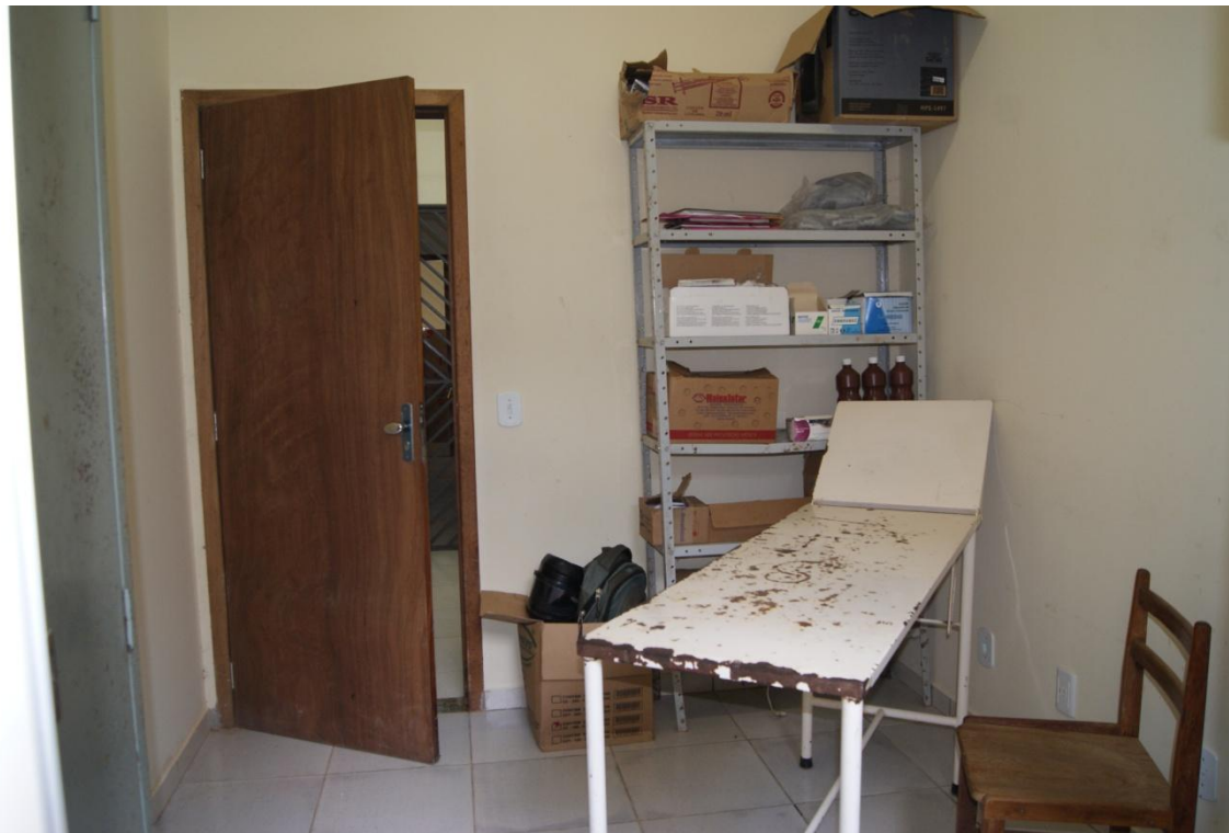
Sala onde funcionará a enfermaria