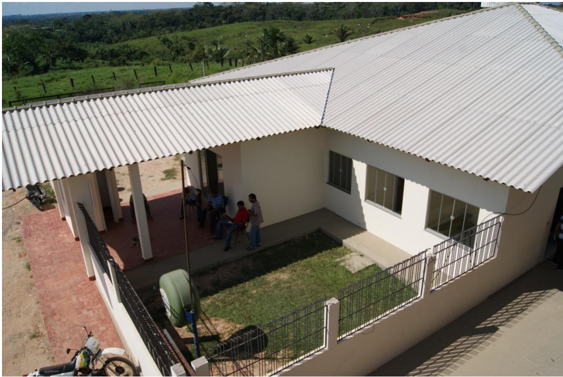
Visão da parte administrativa da unidade